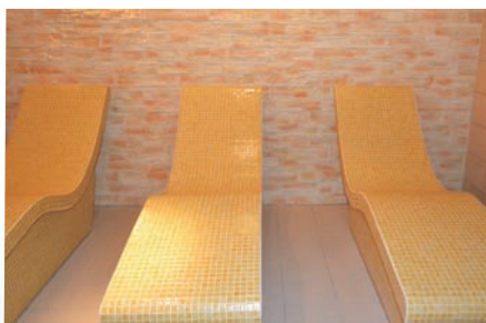
Leżanki podgrzewane przy saunie