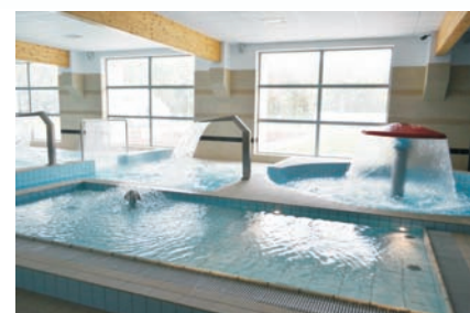
Część rekreacyjna basenu