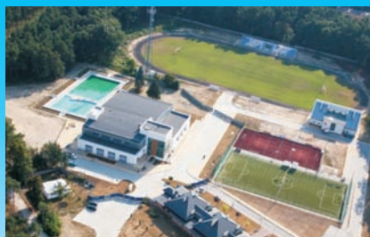
Budynek kompleksu rekreacyjno - turystycznego